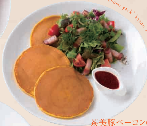
"Chami pork" bacon salad Pancakes

海老とアボカドを贅沢に使用したパンケーキのグラタン仕立て。自家製のベシャメルソースの中にはシェフの愛情がたっぷり詰まった想像以上のおいしさ!