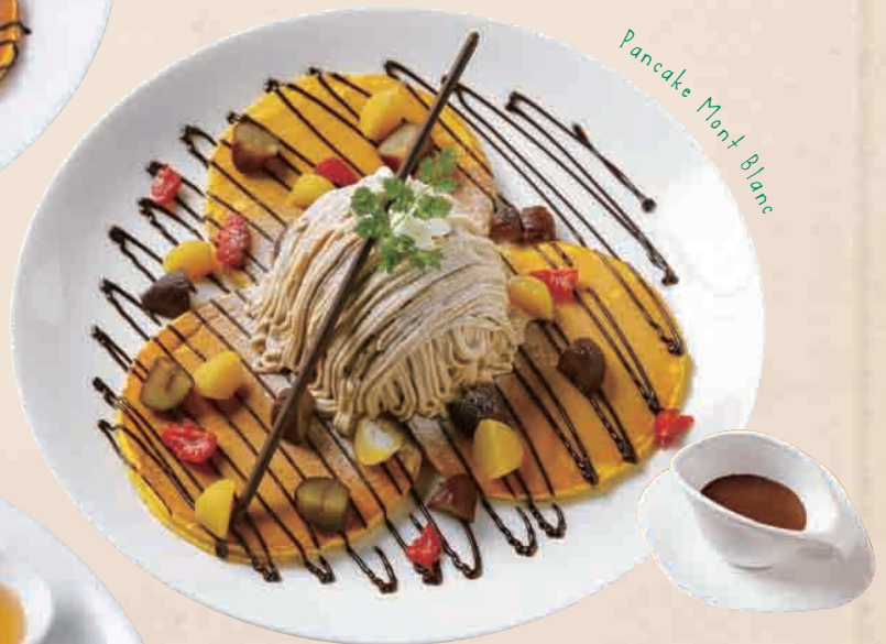
Pancake Mont Blanc

キャラメリゼしたバナナとバニラアイスを乗せ、チョコ&キャラメルソースをたっぷりかけました。ピーカンナッツとアーモンドが食感のアクセント♪