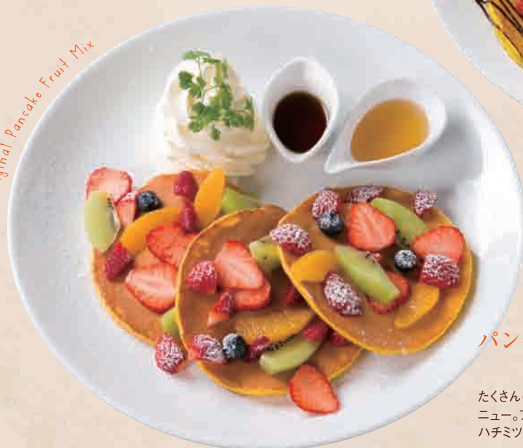
Original Pancake Fruit Mix

フランス産のマロンクリームを使ったモンブランと、その周りには2種類の甘露煮をちりばめ、当店自慢のパンケーキと合わせました。中に冷たいバニラアイスを仕込ませたモンブランは、ご家庭では決して楽しむ事のできない美味しさ!