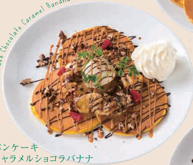
Pancake Chocolate Caramel Banana

茶美豚のベーコン、レタス、トマトのサラダと一緒にいただく、お食事系のパンケーキです。パンケーキに合うようにハニーマスタードのソースで彩りました。